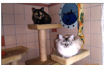
Pucky und Nikko

her um Pucky wieder aufzupäppeln. Es bekam einen neuen Weggefährten, nämlich "Nikko" ein weisser Ragdoll Kater . Dieser sanfte Riese schaffte es, dass Pucky heute wieder lebensfroh herumtrollt und uns auch weiter als Maskottchen treu bleibt.