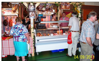
Viel Andrang in der Sporthalle...

Der "Lëtzebuerger Weekend", mittlerweile ein Zugpferd der Region war 2011 auch wieder ein voller Erfolg .