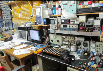
Reparatur und Umbau des Reserve-Sendeputts

Seither ist Serge für die Technik des Senders R.O.M.