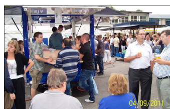
... und auf dem Aussenhof

Da Bilder bekanntlich mehr als Worte sagen, hier einige Impressionen des Events.