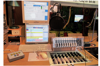
2010, Dezember Radio R.O.M. Hauptsendestudio

Studio 2 befindet sich noch immer in Planung und wird voraussichtlich nicht vor dem 4. Quartal 2011 in Angriff genommen. Zuerst erfolgt eine Komplettüberholung des Mischpultes welches die letzten 20 Jahre im Hauptstudio gedient hat. Das Mischpult im Sendestudio wurde vor einigen Monaten durch ein gleiches Modell ersetzt. Somit kann Studio 2 auch zur Einweisung neuer Moderatoren genutzt werden da hier die gleiche Technik zum Einsatz kommt.