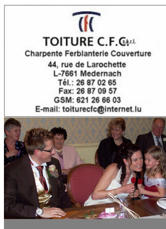
Das Brautpaar auf dem Standesamt