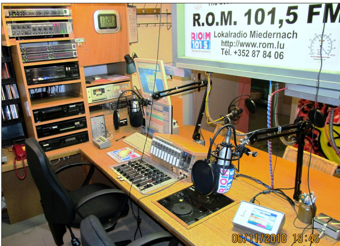
Das aktuelle R.O.M. Studio. Links oben zu sehen: Die Playout-Komponenten für Senderzuführung und Webstream

Strecke für Senderzuführung und Webstream aufgeteilt und kann jetzt entsprechend individuell eingestellt werden. Bei dieser Gelegenheit wurde der Webstream auch auf Stereo umgestellt. In der Senderzuführungskette kam