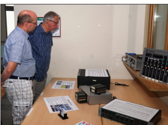
Bestaunen (ur)alter Requisiten aus 25 Jahren Lokalradio

Heute kommt die Musik aller Richtungen aus dem PC. Die Musiktitel und die Reihenfolge sind festgelegt und mit diesem technischen Fortschritt wurde unser Geburtstagskind auch langsam erwachsen. Jüngst hat ein Frequenzwechsel auf der ToDo-Liste gestanden um den Hörern mit besserer Abdeckung des Sendegebietes und gehobener Qualität den Genuss des Senders für die Zukunft interessant zu machen.