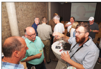
Nach der Feier wurden angeregte Diskussionen geführt

und Unterstützung schaut Radio R.O.M. positiv in die Zukunft.