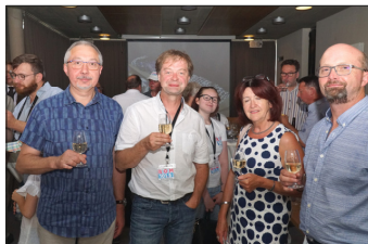
Gute Laune beim anschließenden Umtrunk

ist, für die kameradschaftliche gute Zusammenarbeit des Radioteams, aber vor allem für die freundschaftliche Verbundenheit mit der Gemeinde und den lokalen Vereinen. Nur dank dieser Zusammenarbeit