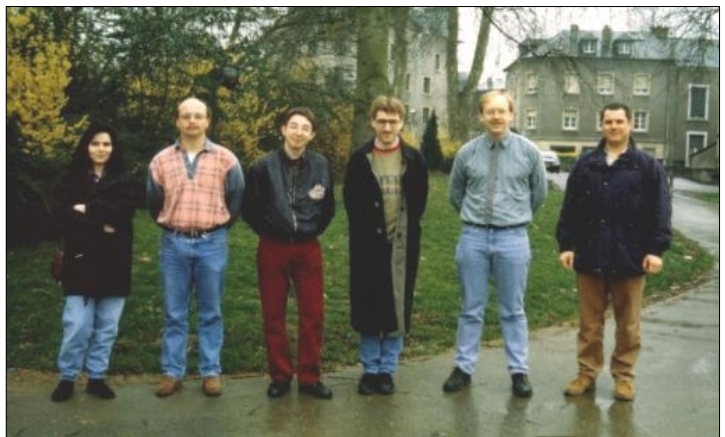
Die Gründungsmitglieder von R.O.M. - 1993

Wie schon im RadioMAG 16 vermutet, erhielt "Radio Lusitana" den Zuschlag für die 106,1 MHz in Bettborn. "Radio Positiva" qualifizierte sich für 106,0 MHz in Esch-Alzette. Für die Frequenz 102,2 MHz in Pétange meldeten sich gleich 2 Kandidaten wobei "Péteng on Air" die Zusage erhielt und "3FM Sud-Luxembourg" leider leer ausging.