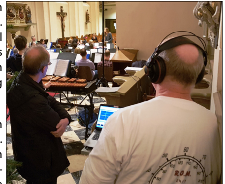
Opnam vum "Concert Spirituel" 2016 an der Porkierch zu Miedernach

Trotzdeem kommen an deenen nächsten Joren Erausforderungen un eis Branche duer, déi mir mat grousser Wahrscheinlechkeet net eleng Schëlleren kënnen. Stéch-