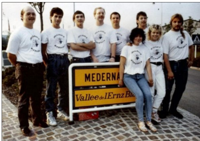
D'Equipp vun "M103" 1988

Dikrech am September 1989 am Congé war, gouf zougeschloen! Den Procureur aus der Staat war ouni Anung vun der Saach, an wousst och net, dat den deemolegen Procureur vun Dikrech näischt géint "M103" wollt ënnerrhuelen. Et koom wéi et huet missen kommen, den 6. September 1989 owes um 7 Auer sinn an ganz Miedernach Gendarmeriesween (13 Autoen an Camionnetten) ronderëm gefuer. D'Haiser vun all den Radiosbedreiwer goufen ëmstallt , den Studio mat sämtlichem Material gouf beschlagnaamt . Zeguer zu Ell bei Réiden gouf d'Haus vun engem Moderator ëmstallt, deen war awer "leider" zu där Zäit an der Vakanz am Ausland. Déi lokal Pompjeeën hun missen den Dag drop mat der Dréileeder d'Antenn zu Miedernach ofmontéieren. Dat een do net esou liicht drun këim hat den Wuechtmeechter Weber bis ewell net beduecht. An-scheinend hat "M103" den Flugfunk gestéiert.