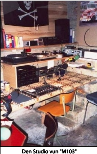
Den Studio vun "M103"

D'Memberen vun "M103" goufen reegelrecht "be-spëtztelt" an beobacht. Deemools stoung wahrscheinlech jiddwereen wou am "Café des Sports" aus- an agaangen ass, ënnert Generalverdacht . Et huet een och missen oppassen wat een an den Café eran an eraus gedroen huet. All elektronischen Apparat huet zu den wëllsten Spekulationen an den Berichter un den Parquet gefouert.