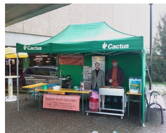
2009, Grillstand Cactus Ingeldorf

Ein großes Lob an die Mitglieder die auch dieses Jahr wieder tatkräftig halfen.