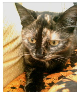
„Pucky“ Radio R.O.M. Maskottchen