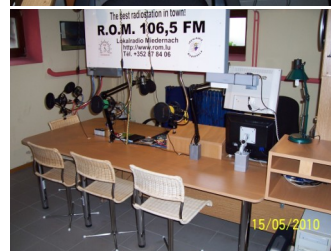
2010, Mai Radio R.O.M. Studio