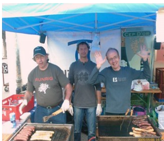
2009, Grillstand Lëtzebuurger Produkter Miedernach

In den letzten Jahren nahm Radio R.O.M. immer wieder an der Ausstellung für luxemburgische Produkte teil.