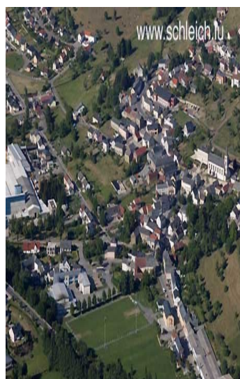
Medernach aus der Luft

„Den Radio MAG“ wird voraussichtlich 2 mal jährlich erscheinen und seine Mitglieder, Werbepartner, lokale Vereine und öffentlichen Instanzen über seine Aktivitäten und Vorhaben informieren.